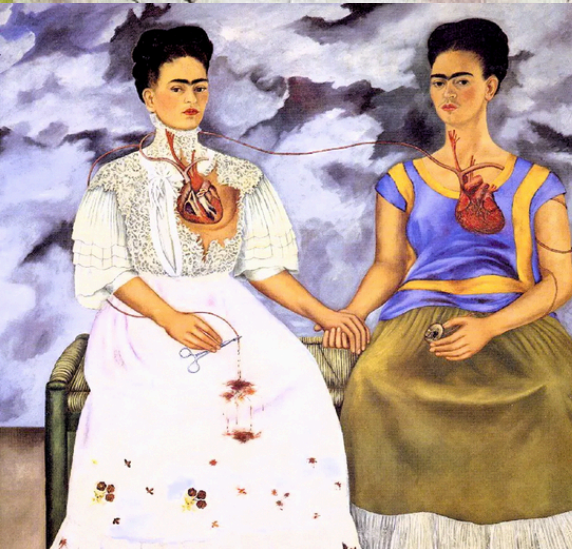
Le due frida